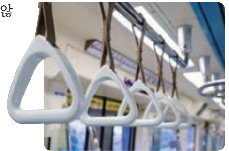
같은 높이로 설치된 손잡이 사람들의 신체적 차이를 고려하지 않고 같은 높이로 손잡이를 설치한 것도 인권 침해의 사례로 볼 수 있다.

이처럼 인권 침해는 우리와 동떨어진 것이 아니며, 일상생활 전반에 걸쳐 다양한 형태로 나타난다.